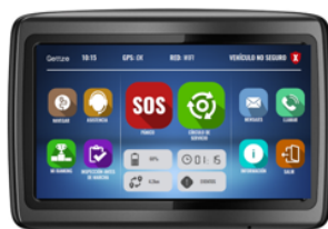
Pantalla en cabina